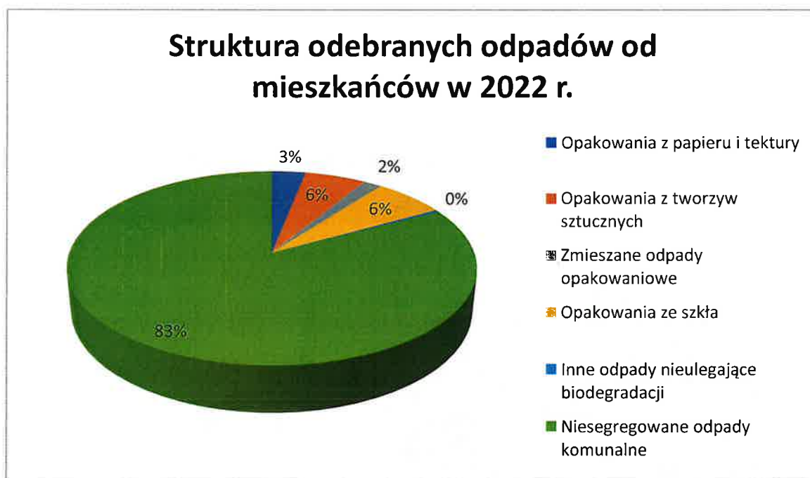
Wykres Nr 1. Struktura odebranych odpadów od mieszkańców w 2022 r.